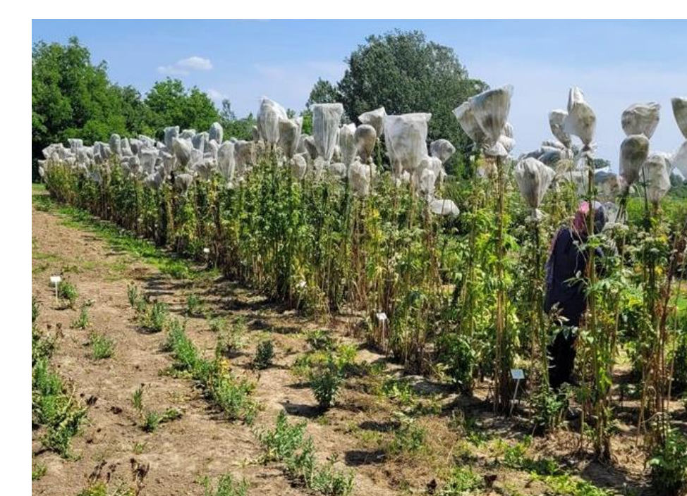
Fotografia 3. Kozłek lekarski - zawiązywanie nasion