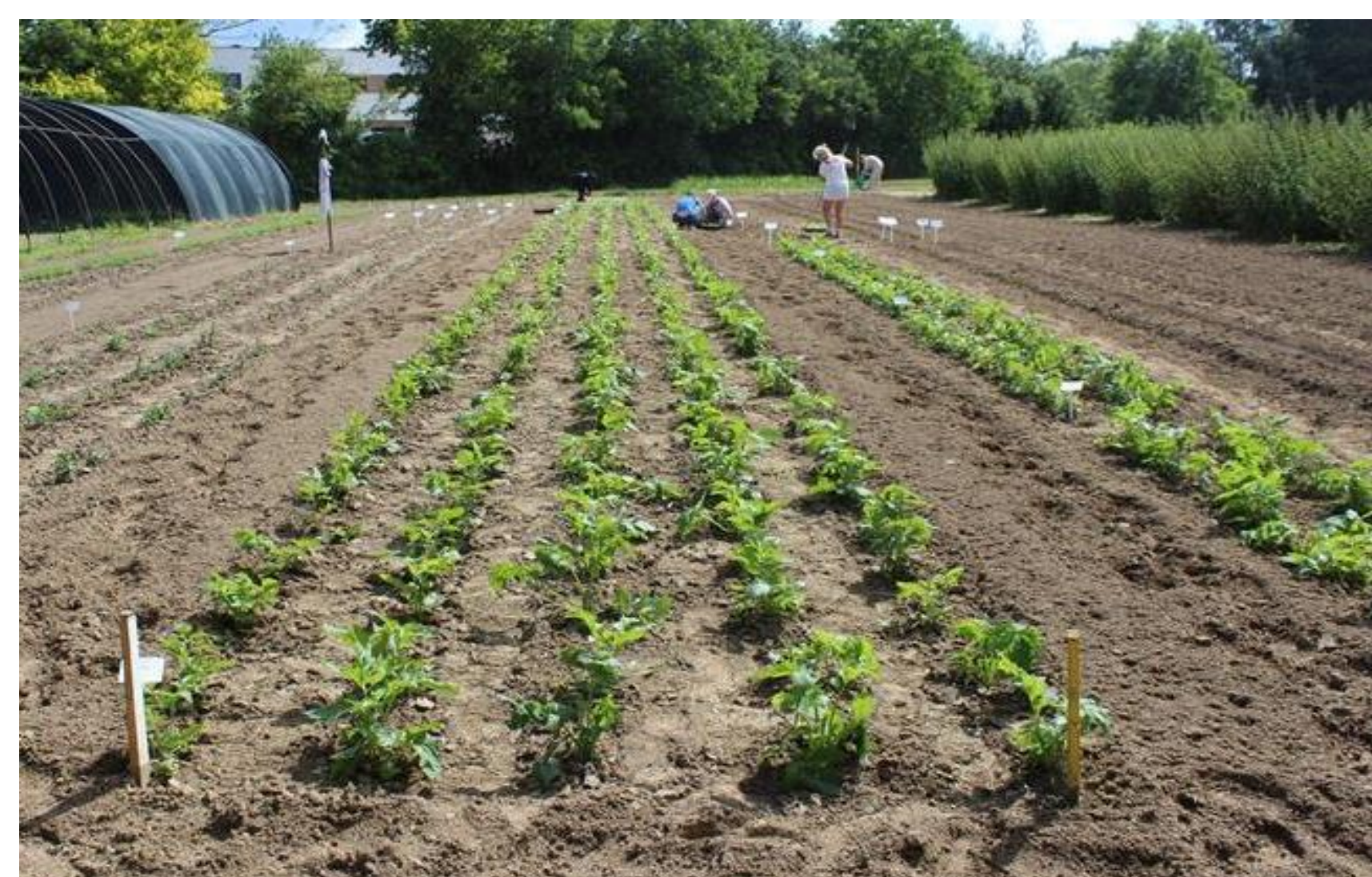
Fotografia 1. Doświadczenie polowe

Kozłek lekarski ( Valeriana officinalis L.) jest ważną rośliną leczniczą uprawianą w Polsce, w tym również z przeznaczeniem na eksport. Plantacje tej rośliny zakładane są z rozsady, najczęściej wytwarzanej przez rolników we własnych, wyspecjalizowanych gospodarstwach zielarskich. Część plantacji surowcowej w tych gospodarstwach przeznaczona jest na uprawę nasienną. Jakość nasion uzyskanych w takich warunkach bywa często słaba, co wynika zarówno z przyczyn agrotechnicznych, jak również niewłaściwej obróbki i ich przechowywania. Celem badań było określenie wpływu zagęszczenia roślin kozłka lekarskiego w uprawie nasiennej na architekturę nasienników oraz plon i jakość uzyskanych nasion.