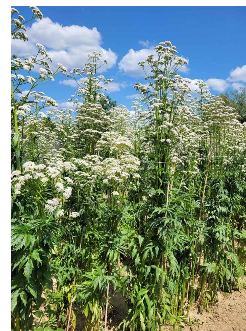
Fotografia 2. Kozłek lekarski - kwitnienie